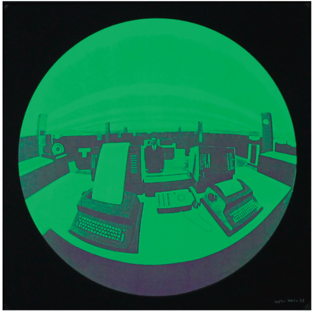
Aislamiento 25. 49x 49 cm. 1973

Son de rabiosa actualidad las obras denominadas “Aislamientos” que comienzan a finales de los sesenta y pasan a ser la obra icónica de Anzo, de gran valor estético y conceptual, se trata de una serie de piezas que el autor empieza plasmando sobre lienzo al óleo. Si inquietud innovadora le lleva a investigar nuevos materiales que harán que su obra adquiera conceptualmente una mayor fuerza para empoderar al hombre en postura hierática que plasma en todos sus cuadros.