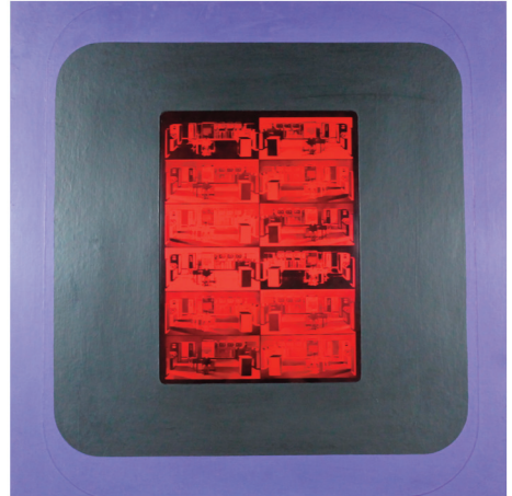
Aislamiento. 89 x 89 cm. 1967

Anzo se aleja paulatinamente del lenguaje Pop. Su narrativa se torna de un realismo casi futurista, y tiene un claro carácter de denuncia sobre el deterioro de las relaciones humanas. Detecta y critica un estatus alarmante ya a finales de los 60, en un tono íntimista, paradójicamente relacionado con la mass media y la globalización. Clara diferencia respecto a las series anteriores, Estampa Popular y Pop Art, que eran de carácter social y de oposición al régimen vigente.