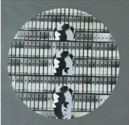
Aislamiento. 32 x 32 cm. 1968