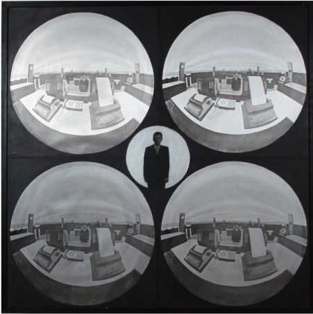
Aislamiento 25. 100 x 100 cm. 1968

Transición. Del Pop Art a los Aislamientos