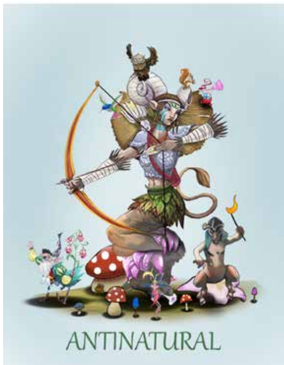
ARTISTA: Pere Baenas