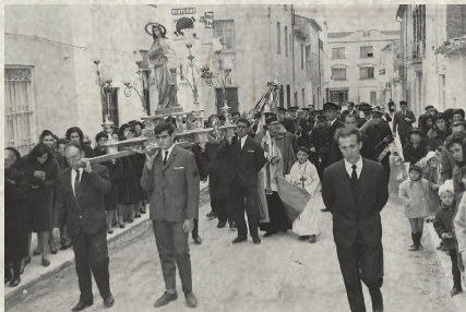
Fiesta de Santa Cecilia en San Antonio, 1965.